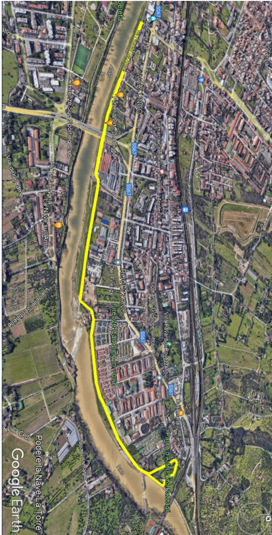
CAMMINATA LUNGO L'ARNO